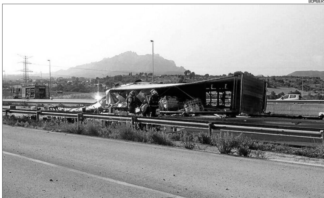
El camió bolcat ahir a la tarda al pas de l'autovia A-2 pel terme municipal d'Esparreguera

■ Els Bombers van rescatar ahir, a primera hora del matí, un excursionista havia caigut per un pendent d'uns 12 metres al massís del Pedraforca. Amb lesions menys greus, va haver de ser evacuat per l'helicòpter del SEM fins a l'hospital Parc Taulí de Sabadell.